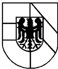
Landkreis Breisgau Hochschwarzwald